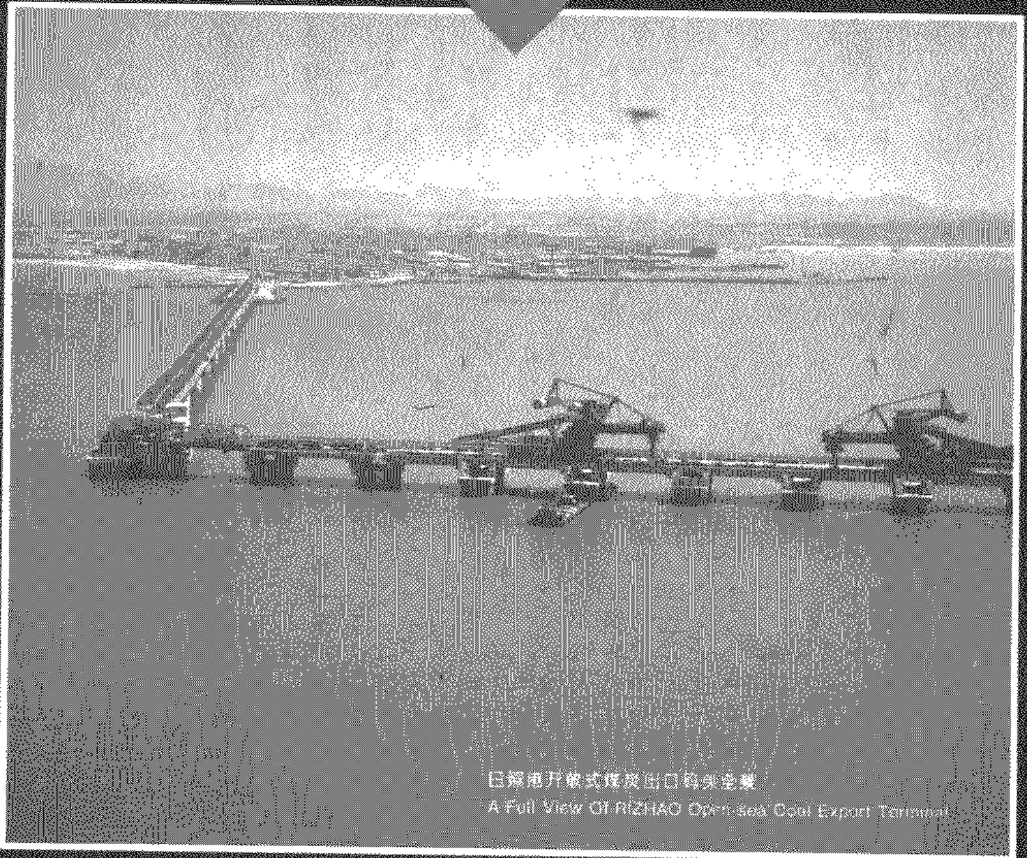
日照市开放式煤炭出口码头全景